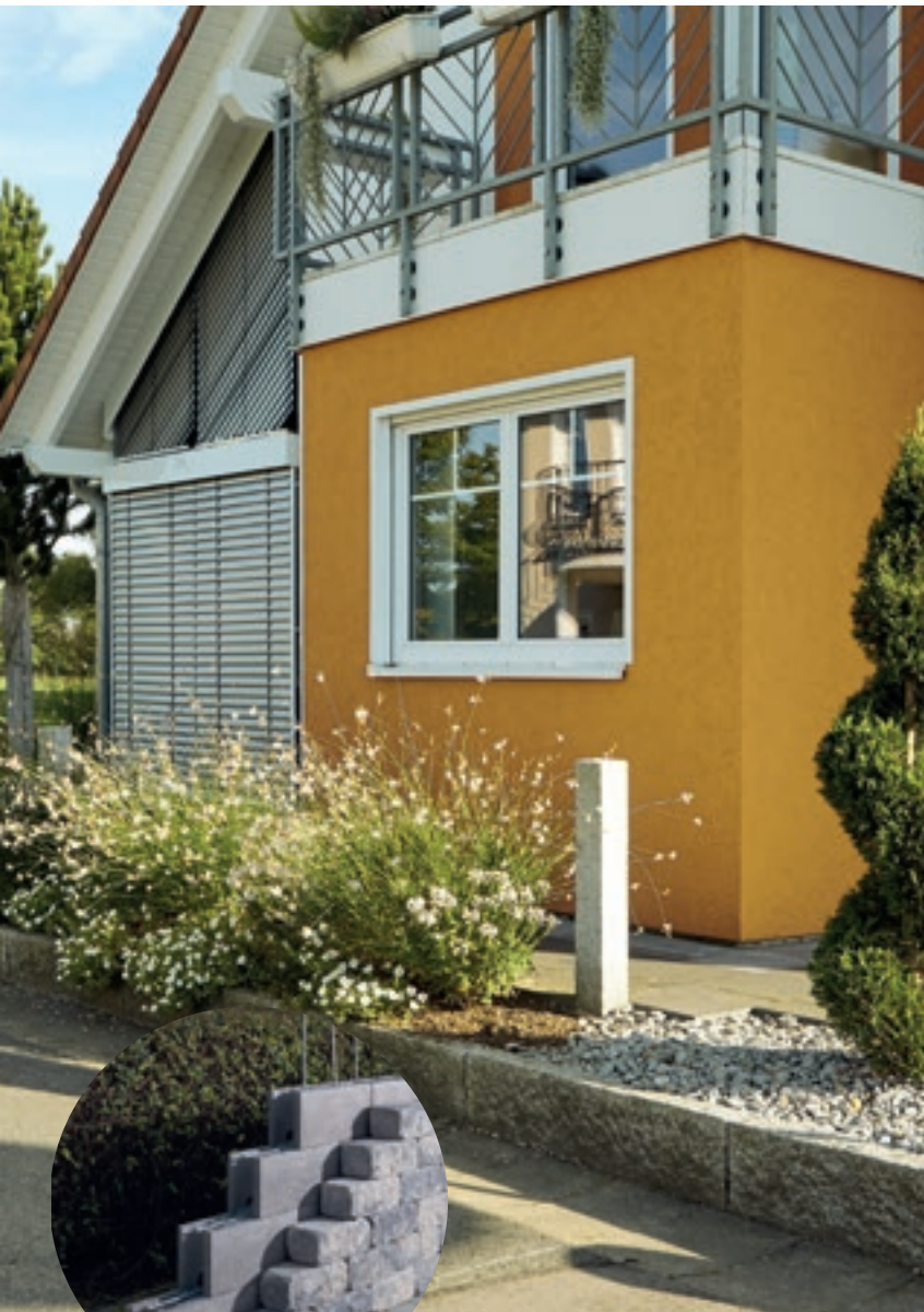
Verbundmauer aus Schalsteinen und Burghof Mauerblock Antik